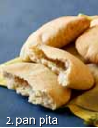
2. pan pita