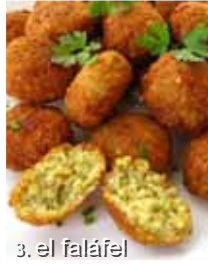
3. el faláfel